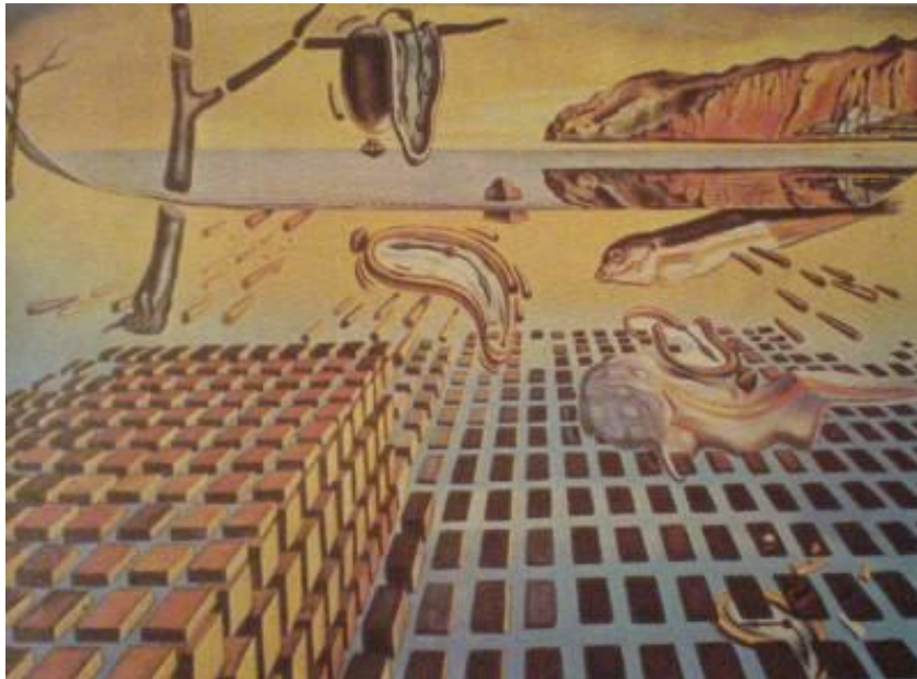
Salvador Dalí: Rozpad perzistencie pamäti