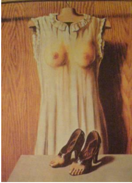
René Magritte (rené magri, 1898-1967): Červený model (olej, 1935). Surrealistický zmysel pre humor a komickosť.