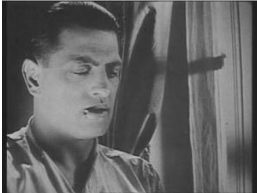
1. L. Buñuel si brúsi britvu.

L. Buñuel, S. Dalí: ANDALÚZSKY PES - UN CHIEN ANDALOU (1928)