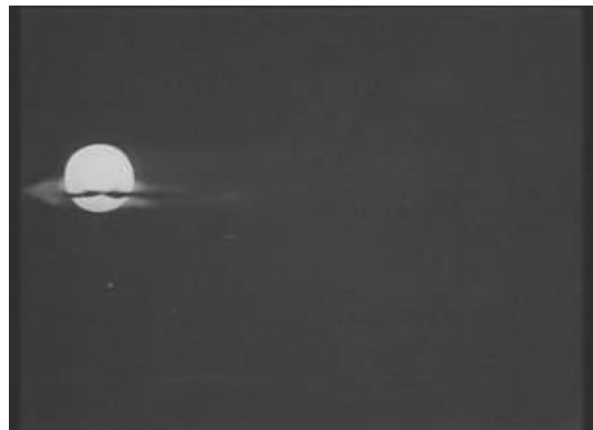
2. Vyjde na balkón a uvidí, ako oblak na nočnej oblohe „reže“ mesiac v splne.