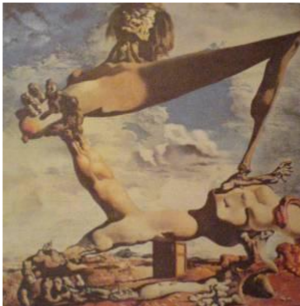
Salvador Dalí (1904 - 1989) Predzvesť občianskej vojny v Španielsku (olej, 1936) Obraz umelca – obrovská masa ľudského tela v delíriu sebaškrtania je metaforickým vyjadrením skutočnosti. Aj v občianskej vojne národ vraždí sám seba.